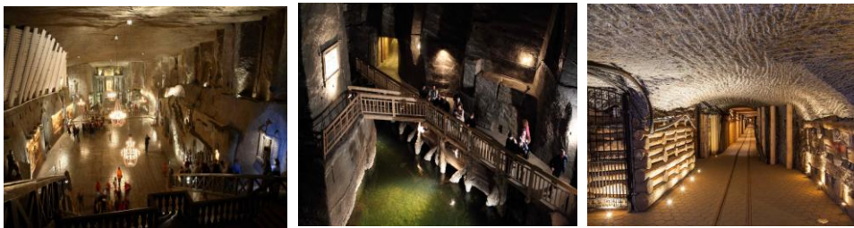
Slika 2. Wieliczka, rudnik soli u Poljskoj

Preko milion posetilaca godišnje dolazi da vidi ovaj neverovatan rudnik soli. Iz razloga bezbednosti manje od jednog procenta rudnika je otvoreno za posetioce, ali i to je skoro 4 kilometra dugih hodnika – više nego dovoljno da turisti provedu sat-dva u obilasku ovih čudesnih prostorija.