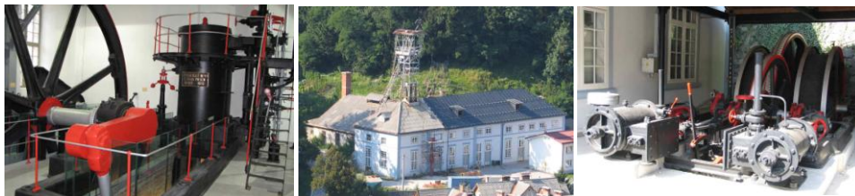
Slika 1. „Idrija” u Sloveniji, bivši rudnik žive

turističke destinacije (Ballesteros & Ramírez, 2007). Dobar primer za to je „Idrija” u Sloveniji, bivši rudnik žive prikazan na slici br. 1. a još bolji je bivši rudnik mrkog uglja u Labinu, u Istri, koji je pretvoren u kulturni centar, gde je već urađen projekt za uređenje „podzemnog grada” na 60.000 kvadratnih metara prostora u napuštenim rudničkim hodnicima i prostorima ( http://www.politika.rs/rubrike/Srbija/Bivsi-rudnici-novi-turisticki-centri.sr.html ).