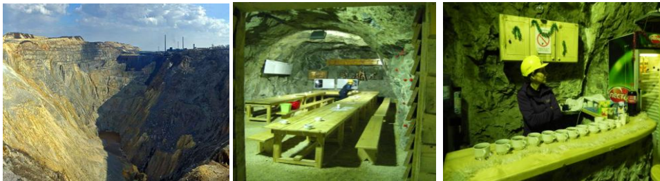
Slika 3. Rudnik bakra Bor.

od 700 metara i da se slikaju i popričaju sa rudarima. Rudnik obuhvata i vidikovac na najstarijem površinskom koku sa koga se vidi stari površinski kop dubok oko 500 metara, a gde je u izgradnji i safari staza na starom jalovištu u dužini od 17 km i sa širinom od 10 metara.